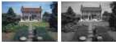
カラー(昼) モノクロ(夜)